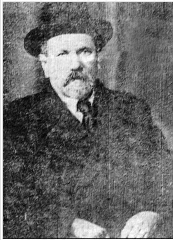
Историк Николай Павлович Анциферов

литературном музее. Он создавал выставки и экспозиции, посвященные русским писателям, публиковал статьи и монографии о литературном прошлом Ленинграда и Москвы, работал над мемуарами 12 . В лице Николая Павловича Анциферова надо отдать дань уважения всем краеведам, многие из которых были репрессированы. Краеведческое движение 1920-х гг. вопреки всему стало беззаветным подвигом остатков русской интеллигенции, в том числе провинциальной, во имя спасения культуры.