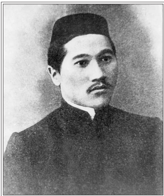
Казахский ученый Мыржакыш (Мир-Якуб) Дулатов

освобожден, вернулся в Ленинград, стал работать профессором антропологии в Центральном географическом музее. Однако в конце ноября 1933 г. последовал второй арест в числе ленинградской группы по делу «Российской национальной партии». По этому делу ученый был осужден на 5 лет и сослан в Сиблаг, где и скончался.