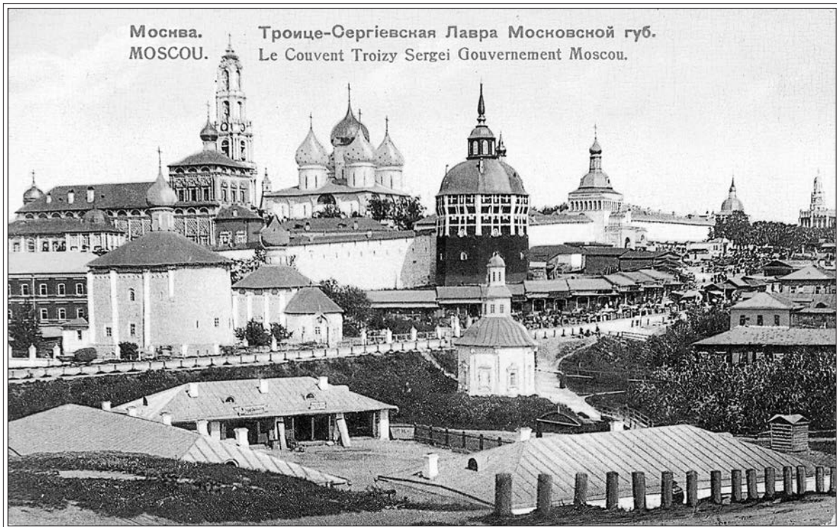
Свято-Троицкая Сергиева Лавра. Открытка нач. XX в.