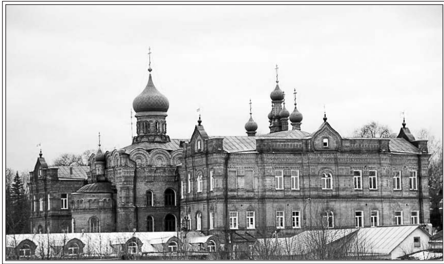
Бывшая больница-богальня в Троице-Сергиевой Лавре. Современная фотография

Кто бы мог предположить, что ближайшие помощники о. Иоанникия — члены Учрежденного Собора — напишут на него донос, такой же нелепый, как сам он писал когда-то на архимандрита Мелетия. В покаянном письме казначая иеромонаха Анатолия в Московскую Синодальную Контору прямо говорится: «Бога ради простите нас за то, что мы сделали ошибку — подали жалобу на о. Настоятеля... простите нас, мы имели примеры от самого о. Настоятеля подать жалобу. При нас в бытность его исправляющим должность казначая с 1888 по 1891 год о. Иоанникий на настоятеля архимандрита Мелетия сделал пять доносов. Все они были сочинены Иоанникием, копии доносов и теперь хранятся в монастырском архиве. Настоятеля сменили, а Иоанникий был прав и оставался на своем месте» 73 . О. Иоанникий в конце своего служения также оказался уволен на покой и изгнан из монастыря в Савватиевский скит, где смиренным