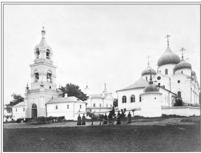
Спасо-Вифанский монастырь. Фотография нач. XX в.

трудился для пользы этой отдаленной обители. Он не жалел своих сил, чтобы поднять обитель до того цветущего состояния, в котором она теперь находится. Всегда ласковый и добрый по отношению к братии, он не иначе назывался ею как „батюшкой“ или „святым отцом“. Со слезами вся братия провожала покойного до места вечного упокоения 63 . «Московские епархиальные ведомости» добавили, что выбор настоятеля Святейший Синод предоставил «братии Соловецкого монастыря, насчитывающей в своей среде много иноков вполне просвещенных и получивших образование в высших гражданских и духовных учебных заведениях» 64 .