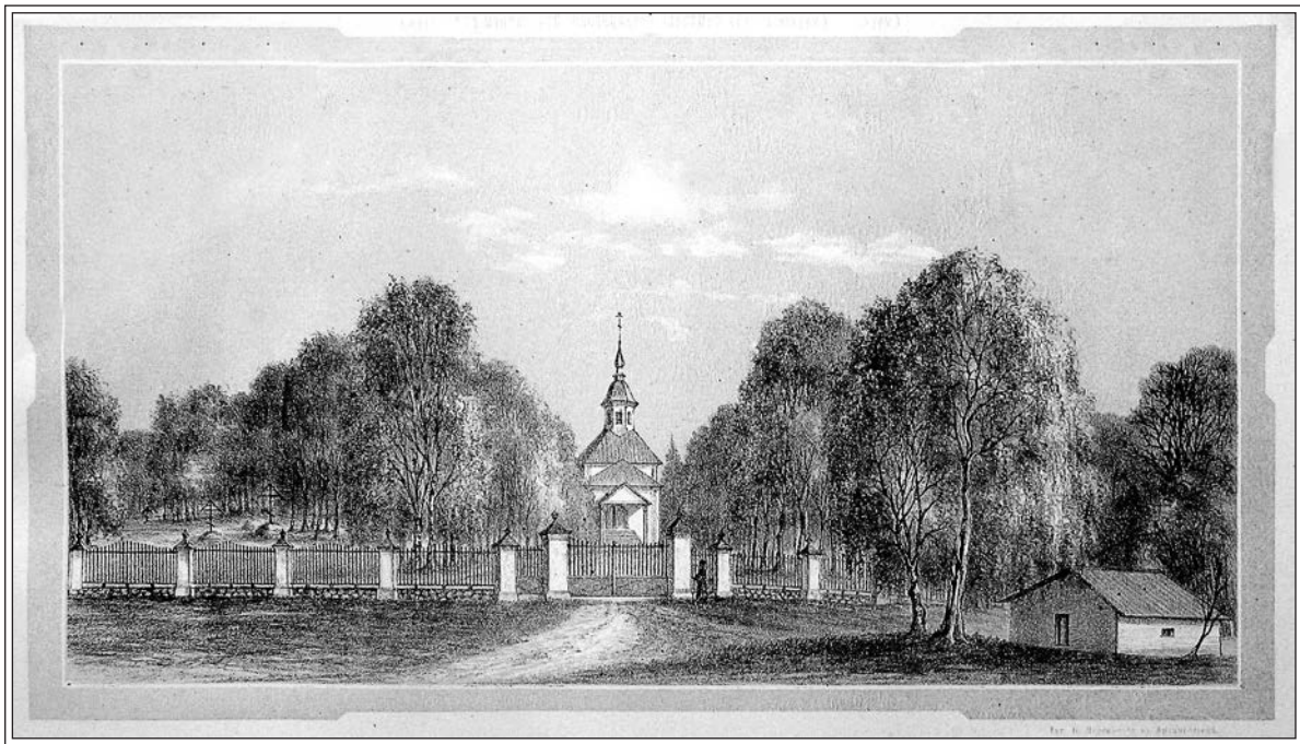
Монастырское кладбище. Литография В.А. Черепанова

Учрежденного Собора продолжали враждовать против него. Поводом для жалобы стало участие монастыря в сооружении каменного соборного храма в г. Кемь. Для разбирательства в 1889 г. Святейший Синод направил в обитель представителя. Согласно отчету ревизора о. Мелетий для ускорения дела иногда расходовал значительные суммы из монастырских средств без обсуждения в Учрежденном Соборе или вопреки мнению Собора, не испрашивая при этом начальственного благословения. Поэтому некоторые его дела были признаны Святейшим Синодом произвольными и единоличными, а именно: работы по укреплению набережной Святого озера, переливка колокола, реконструкция кладбища, учреждение метеорологической станции. 5 апреля 1891 г. Святейший Синод определил: «Архимандрита Мелетия, по преклонности лет и слабости здоровья, уволить от должности настоятеля Соловецкого монастыря, с предоставлением ему права избрать для жительства другой монастырь» 61 .