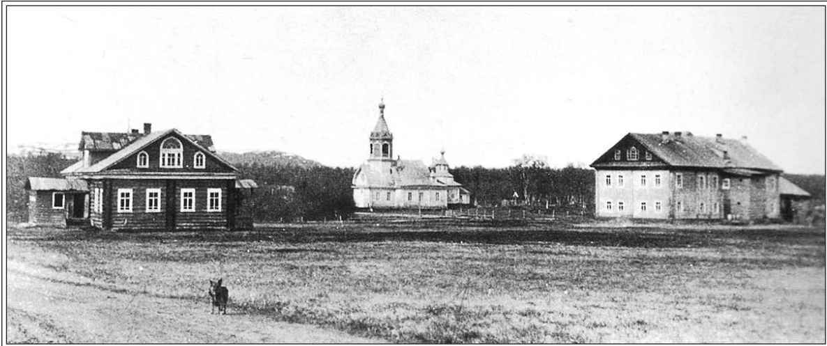
Трифоно-Печенгский монастырь. Фотография нач. XX в.

так и будет, как было, а что я сделаю, то это говорят не нужно и в ущерб обители, и начнут критиковать и меня обвинять, сами ничего не делая» 50 .